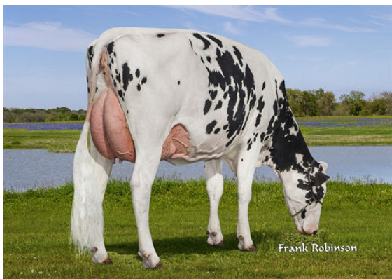
AIR-OSA LINEMAN 19901